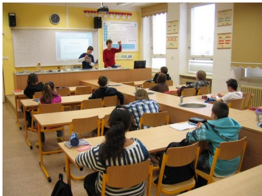
Učebna fyziky a chemie