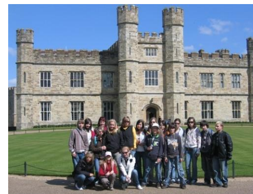
Žáci školy v Anglii před Leeds Castle