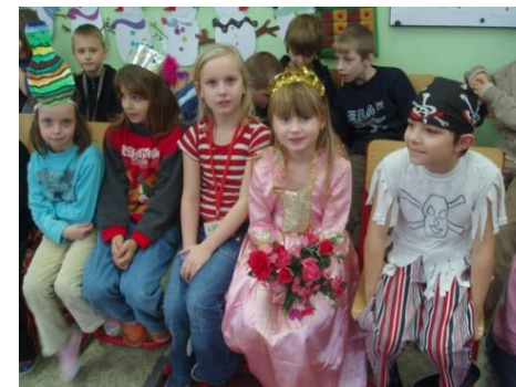
Z pohádky do pohádky - akce školní družiny