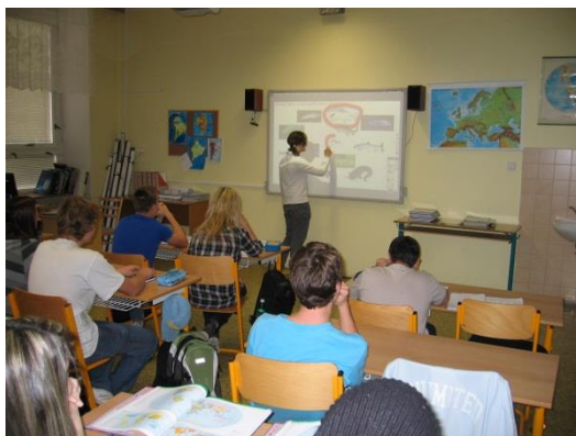
Výuka pomocí interaktivní tabule