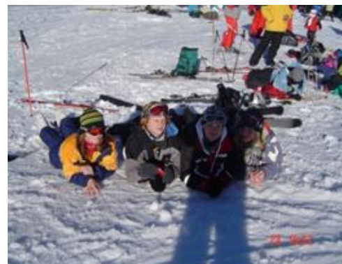
„Lyžák“ v Tatrách