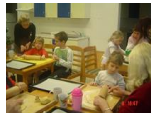
Společné vánoční pečení rodičů s dětmi