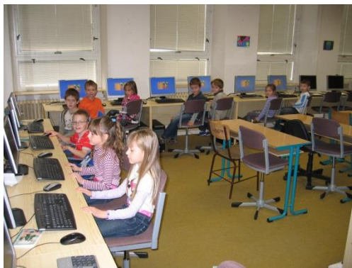
Počítačová učebna VT 2