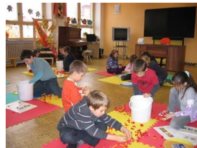
Specializovaná učebna 1. stupně