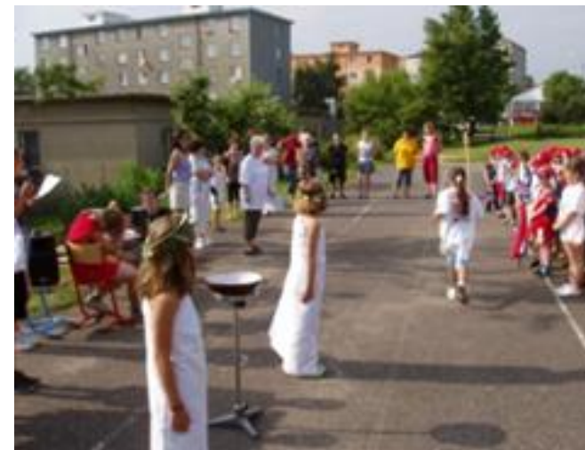
Závěrečná část celoročního projektu Školní olympiáda